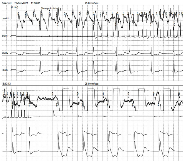
注: 起搏器识别到快速型房性心律失常 (ATA) 后启动心房抗心动过速起搏 (aATP) 干预 [以周长短起搏 (Ramp) 方案进行起搏], 1 min 内成功终止 ATA。